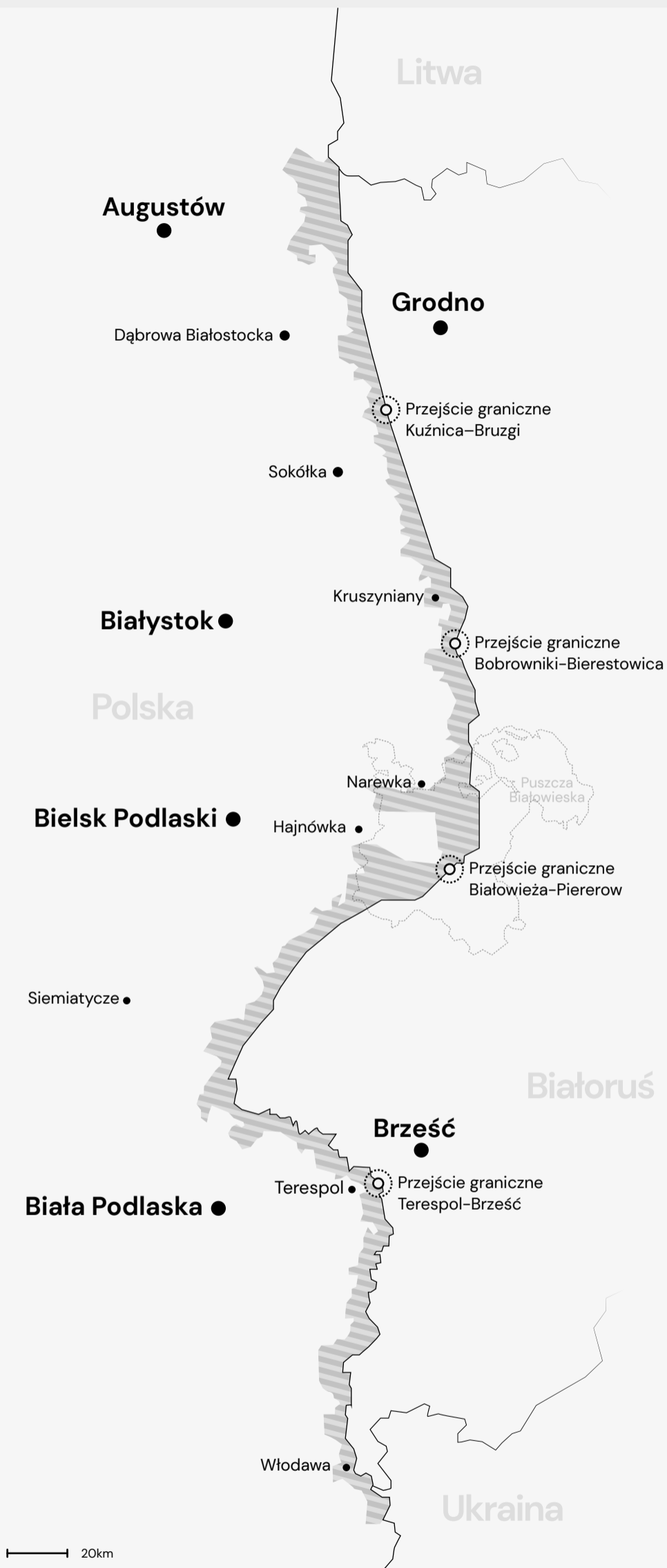
Mapa 2. Teren objęty stanem wyjątkowym.

Od 8 listopada sytuacja na granicy uległa zaostrzeniu. Migranci i migrantki uwięzieni od wielu dni na terenach przygranicznych i w okolicznych miastach po białoruskiej stronie oraz nowi przybysze, którzy tego dnia zostali przywiezieni z Mińska, świadomi tego, że pozostają całkowicie zależni od politycznej rozgrywki między Białorusią, Polską a Unią Europejską, zdecydowali się wyruszyć dużą grupą w kierunku oficjalnego przejścia granicznego Bruzgi-Kuźnica. Planowali upominać się tam o swoje prawa, a także zwrócić uwagę mediów na sytuację, w jakiej się znaleźli. Niedaleko samego przejścia zostali jednak siłowo zepchnięci przez białoruskie służby w kierunku „zielonej” granicy i drutów żyletkowych rozstawionych przez polskie służby. Tam zostali przymuszeni do „forsowania” zasieków, co doprowadziło do znacznego zwiększenia obecności polskiego wojska, funkcjonariuszy Straży Granicznej i Policji w tym rejonie. Sytuacja, jaką udało się wytworzyć białoruskim służbom, grozi dalszą eskalacją przemocy na granicy.